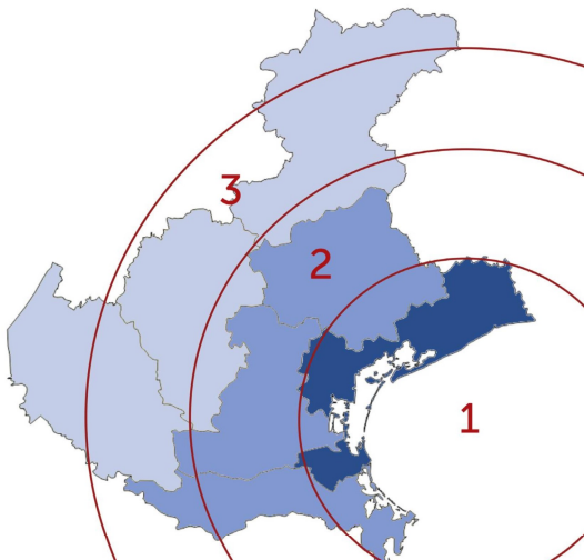
Fig. 2 - Inquadramento territoriale della città di Venezia.

1. Suddivisione dell'area geografica di allocazione dei turisti. La valutazione presuppone che i visitatori si trovino in una delle sette province del Veneto. In questo modo, è possibile stimare i costi di viaggio sostenuti dai turisti per visitare la Chiesa. La figura (vedi Fig. 2) illustra la suddivisione dell'area geografica in tre zone: 1) la città metropolitana di Venezia, 2) le province di Padova/Rovigo/Treviso e 3) le province di Belluno/Vicenza/Verona.