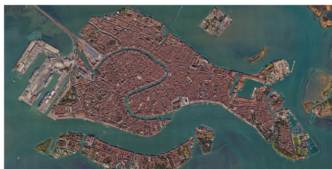
Fig. 1 - Inquadramento territoriale della città di Venezia.

La Chiesa di Santa Maria dei Miracoli è stata scelta come uno dei casi studio pilota del progetto ResCult, in quanto rappresenta un edificio storico ed ecclesiastico rappresentativo della città di Venezia, che è vulnerabile agli eventi di allagamento, colpito dalle acque alte della laguna di Venezia, ma anche ai rischi di terremoto e incendio.